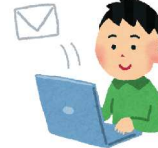
メールやチャットをする