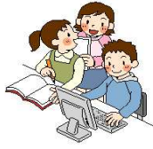
いろいろな情報をさがす

全国の小学生（5，6年生）で、「インターネットを利用している」と答えた児童がインターネットを利用して、していることは、何が一番多かったでしょうか。