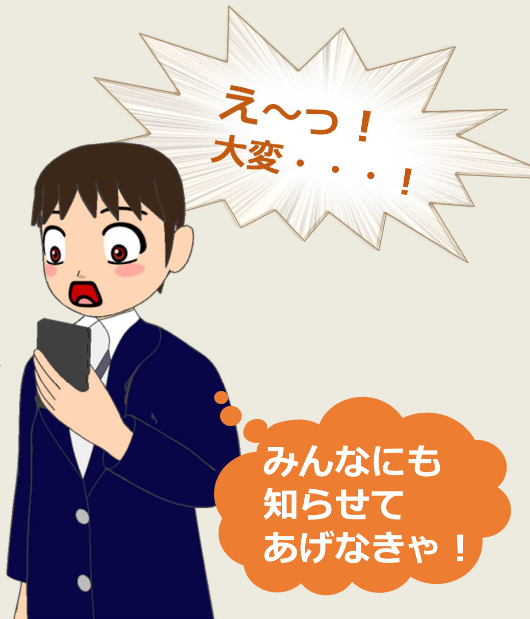
眉山 (びざん) さん