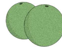
かいふくアイテム