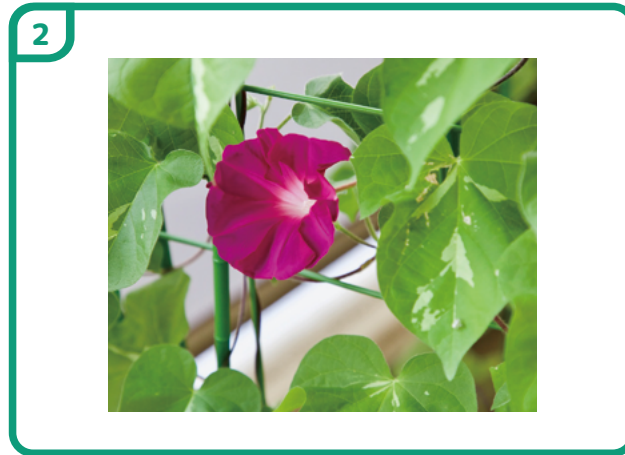
しゃしん 写真だけをのせたスライド